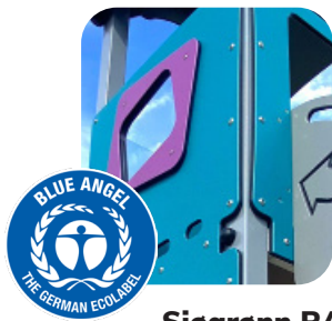
Sjøgrønn RAL 5021