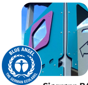
Sjøgrønn RAL 5021