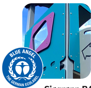
Sjøgrønn RAL 5021