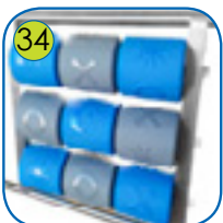
34 TIC TAC TOE spillet er lagt av polyethylene uten skarpe kanter. Rullene er 160 mm høge og 150 mm brede, fulle av forskjellige symboler.