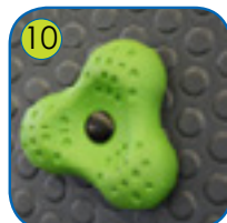
10 Klatregrep lagt av fliser og polyesterresin