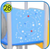
28 Aktivitetsplatene er lagt av fargerik 15 mm tykk HDPE plast. UV resistant. Bevegelige deler av støpt polyamide.