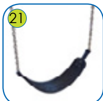
21 Fleksibelt huskesete av gummi med kjerne av belterem. Kjeder i 6 mm rustfritt stål.