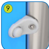
9 Monteringsdeler av støpt polyamide.