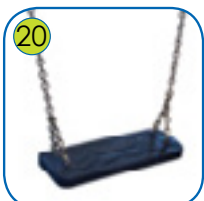
20 Huskesete i mykt EPDM gummi med kjerne av aluminium. Kjeder i 6 mm rustfritt stål.