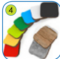
4 Vegger og plattformer er lagt av fargerik trelags, 13 mm tykk HPL (sorte plater er 8 mm) HPL. UV resistent.