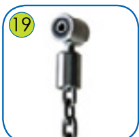
19 Huskeoppheng med dobbel lagre, laget av rustfritt stål.