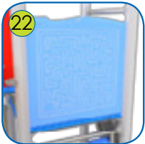
22 Aktivitetsplatene er lagt av fargerik 15 mm tykk HDPE plast. UV resistant.