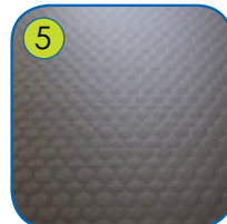
5 10 mm anti-skli HPL plattform. Meget værbestandig.