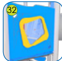
32 ùknuselig hammerplast 8 mm tykk.