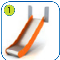
1 Sklie av rustfritt stål AISI 304. Metalblad 2 mm, formet med CNC teknik. Sidepaneler av 15 mm, UV resistent HDPE plast.