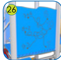
26 Aktivitetsplatene er lagt av fargerik 15 mm tykk HDPE plast. UV resistant.