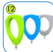
12 Ergonomisk utformet klatreringer i polyetylene.