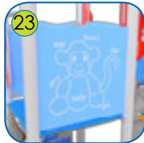
23 Aktivitetsplatene er lagt av fargerik 15 mm tykk HDPE plast. UV resistant.