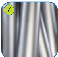
7 Solid konstruksjon av rustfritt stål AISI 304.