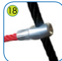
18 Tau avsluttes i en ende av holdbar aluminiumslegering.