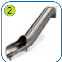
2 Tunellsklie av polert rustfritt stål AISI 304. Tunellbladet er 2 mm tykk og er avsluttet med et rør Ø33,7 mm.