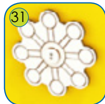
31 Roterende modul av 13 mm tykk HPL plate.