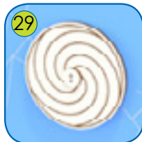
29 Roterende modul av 13 mm tykk HPL plate.