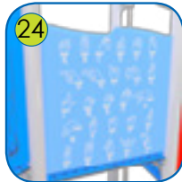
24 Aktivitetsplatene er lagt av fargerik 15 mm tykk HDPE plast. UV resistant.