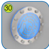
30 Roterende labyrinth med bevegelig ball. Lagt av HDPE plate, hammarglass og rustfritt stål.