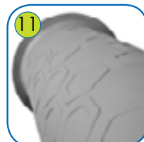
11 Tube av LDPE. Innerdiameter 533 mm.