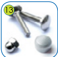
13 Monteringselement, skruer, bolter, skiver - av rustfritt stål.