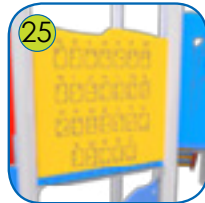
25 Aktivitetsplatene er lagt av fargerik 15 mm tykk HDPE plast. UV resistant.