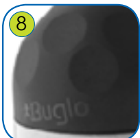
8 Toppene på stolpene er lagt av mykt EPDM gummi.