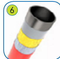
6 Konstruksjon av sandblåst svart stål S235JR. Galvanisert, pulverlakkert med sertifisert polyesterfarge QUALICOAT.