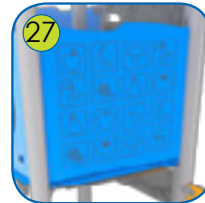
27 Aktivitetsplatene er lagt av fargerik 15 mm tykk HDPE plast. UV resistant.