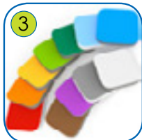
3 Veggpanelene er lagt av fargerik trelags, 15 mm tykk HDPE plast. UV resistent.