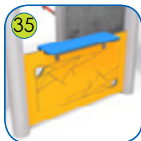
35 Veggplate lagt av fargerik 15 mm tykk HDPE.