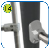
14 Patentert monteringsystem av aluminiumslegering. Pulverlakkert med UV resistent, sertifisert polyesterfarge QUALICOAT.