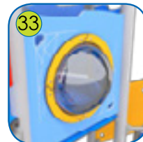
33 Halvkuleformet vindu, Ø 400 mm. Transparent termoplast i 5 mm. Meget tålig.