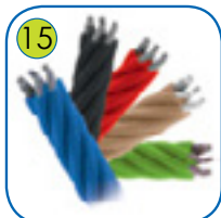
15 Ø 16 mm polypropylen tau med ståljerne.