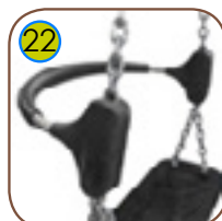
22 Ryggstøtte i myk polyuretan med kerne av stål.