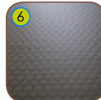
6 10 mm anti-skli HPL plattform. Meget værbestandig.