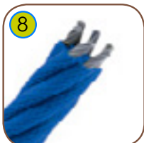
8 Ø 16 mm polypropylen tau med stålkerne.