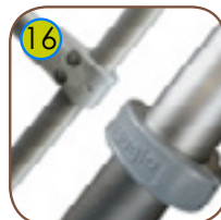
16 Patentert monteringsssystem av aluminiumslegering. Pulverlakkert med UV resistant, sertifisert polyesterfarge QUALICOAT.