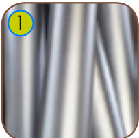
1 Solid konstruksjon av rustfritt stål AISI 304.