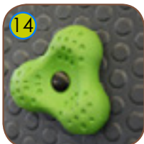
14 Klatregrep lagt av fliser og polyesterresin