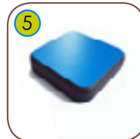
5 Vegger og plattformer er lagt av fargerik trelags, 13 mm tykk HPL (sorte plater er 8 mm) HPL. UV resistant.