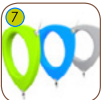
7 Ergonomisk utformet klatreringer i polyetylene.