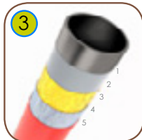
3 Konstruksjon av sandblåst svart stål S235JR. Galvanisert, pulverlakkert med sertifisert polyesterfarge QUALICOAT.