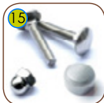
15 Monteringslement, skruer, bolter, skiver - av rustfritt stål.