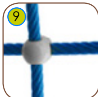
9 Solide taukryss av støpt polyamide.