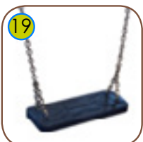
19 Huskesete i mykt EPDM gummi med kerne av aluminium. Kjeder i 6 mm rustfritt stål.