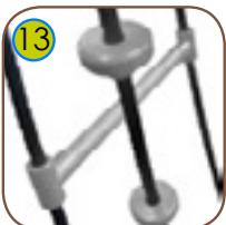
13 Taustige og tauknoter av støpt polyamide.