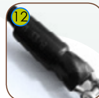
12 Tau avsluttes i en ende av holdbar aluminiumslegering.