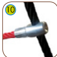
10 Tau avsluttes i en ende av holdbar aluminiumslegering.