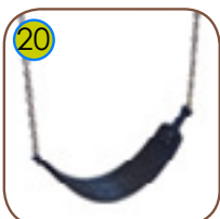
20 Fleksibelt huskesete av gummi med kerne av belterem. Kjeder i 6 mm rustfritt stål.