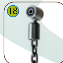
18 Huskeoppheng med doble lagre, laget av rustfritt stål.