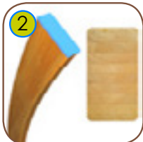
2 Impregnernt limtre. Tykkelse 90 mm Bredde 260 mm Lengde 2800 mm