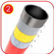
2 Solid sandblåst og galvanisert konstruksjon laget av sort stål S235JR. Pulverbelegg med polyester-maling QUALICOAT attestert.