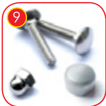
9 Elementer som skruer, pottetter, skiver er laget av rustfritt stål. Vandalsikker skruepluggen laget av injeksjonstøpt polyamid.