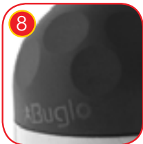
8 Stolpene avsluttes med myk EPDM gummi