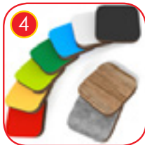
4 Veggplater og plattformer laget av fargerik 13 mm plate in blå eller grå farge. HPL (svarte plater laget på 8 mm HPL), helt fukt-sikker.