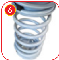
6 Vippefjær Ø 200 mm og den stangen Ø 20 mm. Fjærene og festene er galvanisert og pulver belagt med polyester-maling, UV-bestendig og QUALICOAT attestert. Festene er designet spesielt for løsninger brukt på en lekeplass, uten elementer som kan forårsake fare for barn.