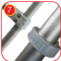
7 Koblinger laget av sterk aluminiumslegering. Aluminium er sikret ved prosessen med elektroforese og pulverbelegg med polyester-maling UV-bestendig og QUALICOAT attestert.