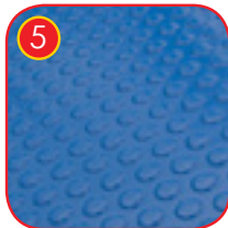
5 Sklisikker 18 mm HDPE Veldig høy motstand mot værforhold og slitasje.