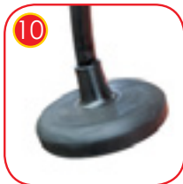
10 Sete av myk gummi, forsterket med stålplate. Henger på en galvanisert kjede dekket av en gummi trekk.