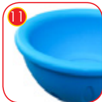
11 Karusellsete laget av polyetylen, rotasjonsstøpt. Diameter på sete: 55 cm