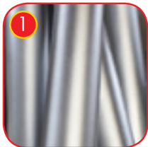
1 En solid struktur laget av AISI 304 rustfritt stål.