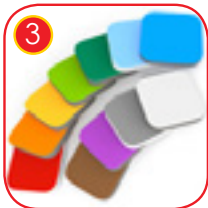
3 Veggplater i fargerik trippellags 15 mm HDPE polyetylen. Fuktsikker og uv-bestendig.