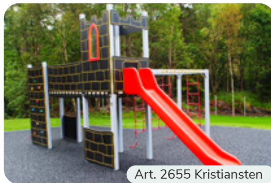
Art. 2655 Kristiansten