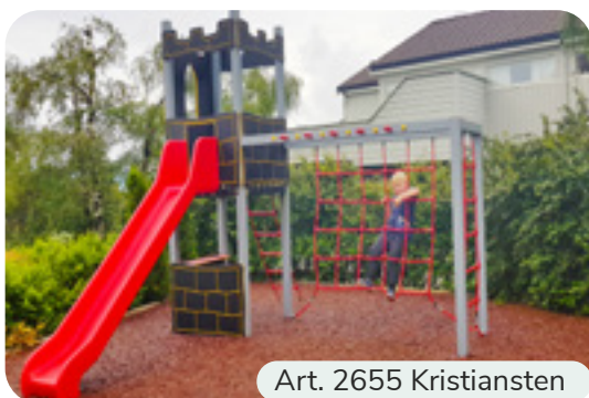
Art. 2655 Kristiansten