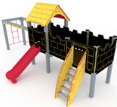
Art. 2640 Trondenes