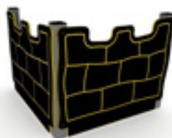
Art. 2662 Borghjørne

Alle våre lekeapparater er produsert i henhold til Norsk Standard NS-EN1176