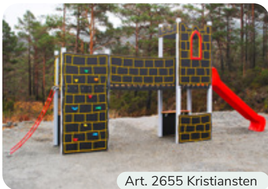
Art. 2655 Kristiansten