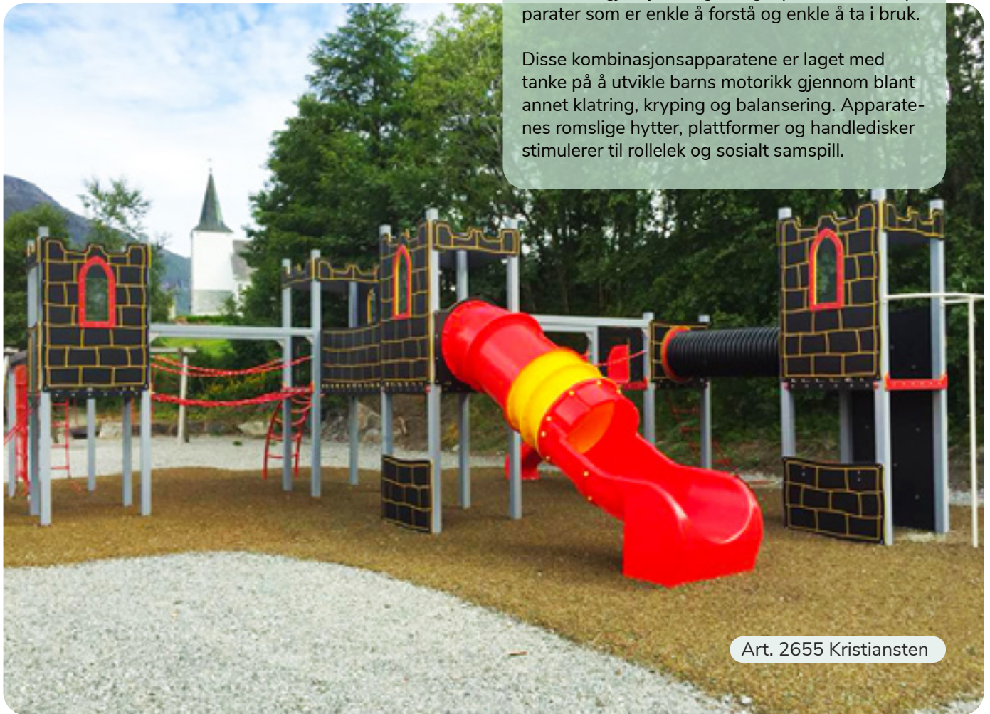
Art. 2655 Kristiansten

Disse kombinasjonsapparatene er laget med tanke på å utvikle barns motorikk gjennom blant annet klatring, kryping og balansering. Apparatenes romslige hytter, plattformer og handledisker stimulerer til rollelek og sosialt samspill.