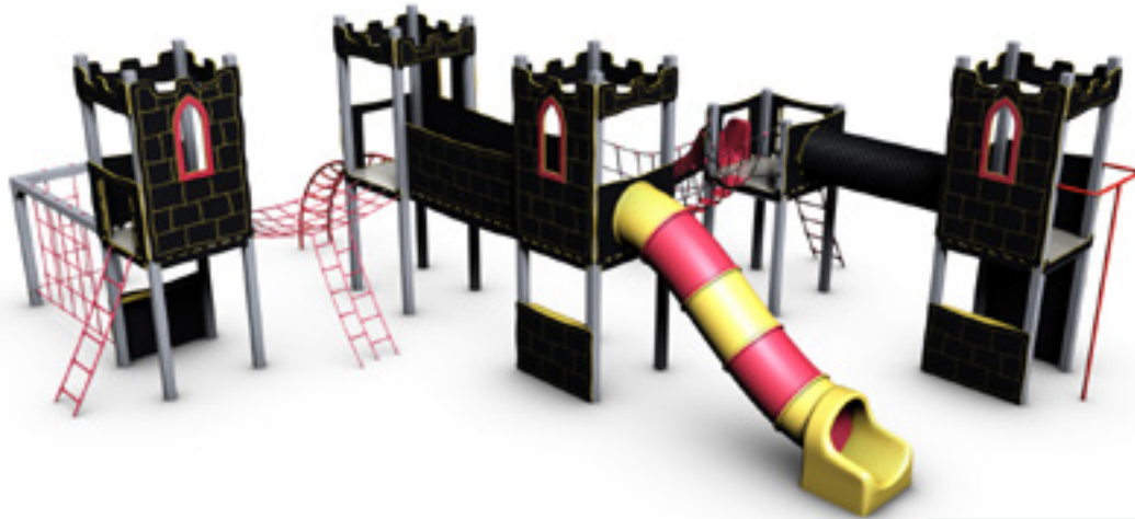
Art. 2655 Kristiansten