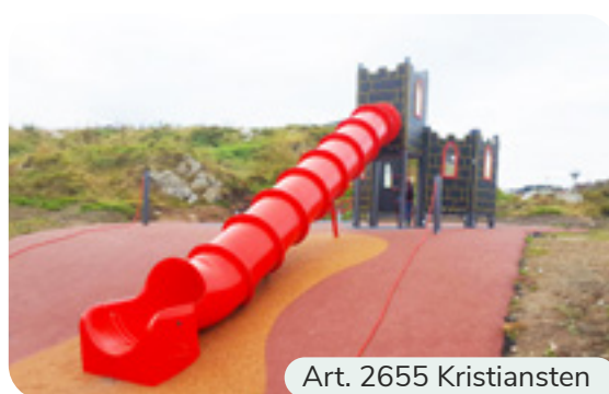
Art. 2655 Kristiansten