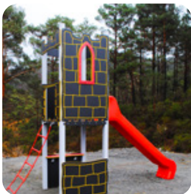
Art. 2652 Vardøhus