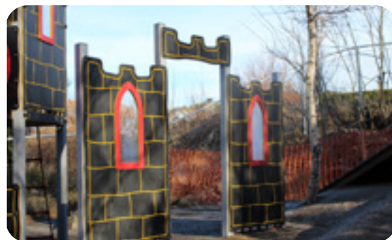
Art. 2660 Borgport Port bestående av 2 høye borg- vegger med vinduer. Veggene kan også bestilles mon- tert i vinkel.