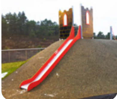
Art. 2658 Gyldenløve